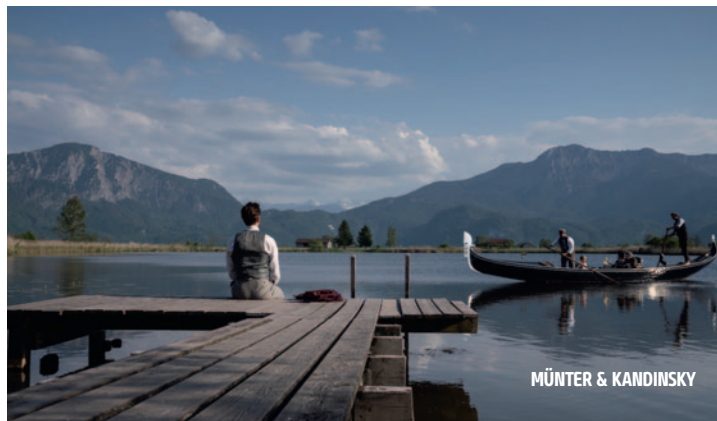
MÜNTER & KANDINSKY

Der einzelgängerische Lutz hofft als Leiter eines großen Bauprojekts die Investoren von sich zu überzeugen und in der Folge weitere lukrative Aufträge zu erhalten. Um Kosten zu sparen heuert er illegale Arbeiter an, doch ein tragischer Unfall gefährdet Lutz' avisierten Aufstieg. Kurz nach dem Unfall taucht die 14-jährige Irsa aus Albanien auf Lutz' Baustelle auf. Sie sucht nach ihrem vermissten Vater. Immer wieder drängt sie mit der ihr eignen Unnachgiebigkeit in Lutz' Leben. Sie spürt, dass irgendetwas nicht stimmt und dass Lutz mehr weiß, als er zugibt. Lutz will Irsa nach Albanien zurückbringen, doch die Fahrt durch wunderschöne Panoramen wird durch das Wissen um das Schicksal von Irsas Vater, das Lutz bekannt ist, ihr aber nicht, geprägt. Förderpreis neues deutsches Kino der Hofer Filmtage 2023. DE 2023, 90 Min., FSK ab 12 J., Regie: Tuna Kapitan, Drehbuch: Fentje Hanke, Besetzung: Anjela Prenci, Peter Schneider, Kamera: Ben Bernhard