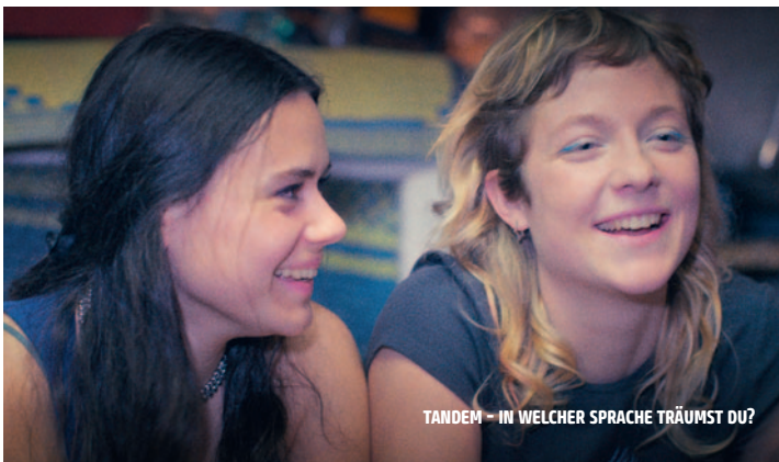
TANDEM – IN WELCHER SPRACHE TRÄUMST DU?