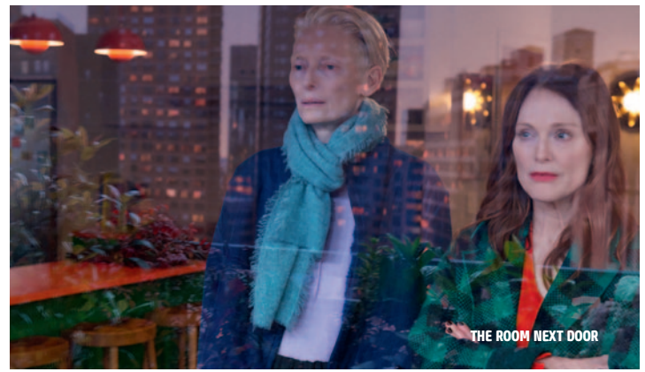
THE ROOM NEXT DOOR