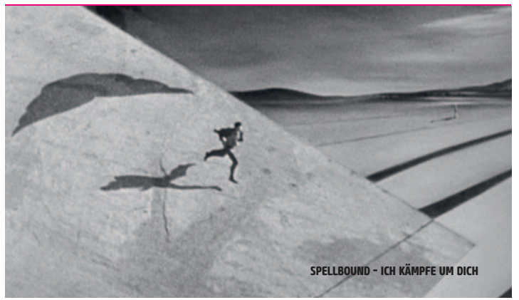
SPELLBOUND - ICH KÄMPFE UM DICH